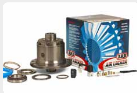
Bloqueo de diferencial ARB.