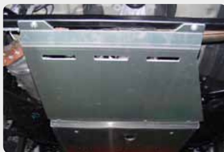
Protector de tr nsfer. 189.5235.3 - acero zincado 189.5254.3 - duraluminio