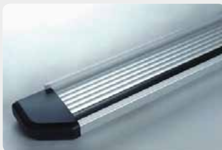
Estribos en plataforma de aluminio. Tipo STD. 072.PF-50814 - doble cabina