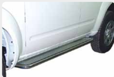
Estribos en plataforma de aluminio (gota) con tubo inox Ø38mm. 189.5244 - doble cabina