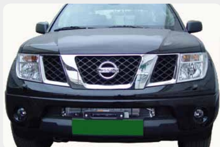
Base de cabestrante "oculta" para instalar en parachoques de origen. 189.5251