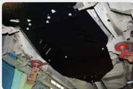
Protector tr nsfer y caja de cambios SHERIFF.