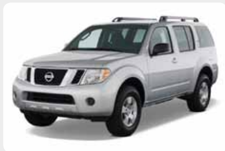
* Pathfinder [2005 - 2010] * Pathfinder [2010-] restyling