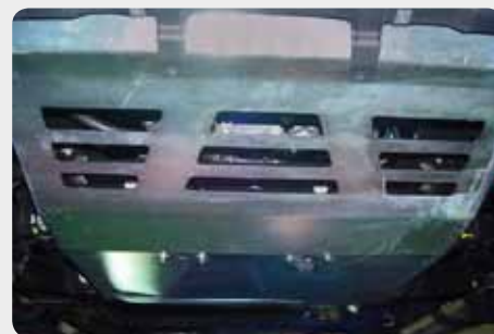
Protector de cárter y barras de dirección. 189.5235.1 - acero zincado 189.5254.1 - duraluminio