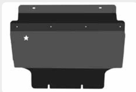
Protector radiador SHERIFF. *S lo para Pathfinder [2010-] 190.15.1936 - acero 190.15.1937 - aluminio