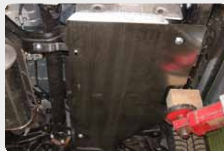
Protector dep sito SHERIFF.

190.15.1713 - acero 190.15.1714 - aluminio