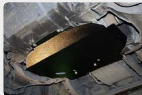
Protector c rter SHERIFF. 190.15.0757 - acero 190.15.0759 - aluminio