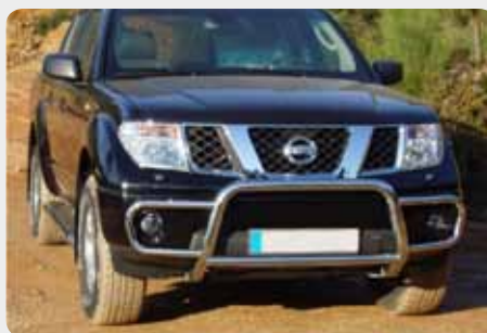
Defensa integral inox baja sin grabación. Homologación CE. 189.5273.CE - Ø60mm