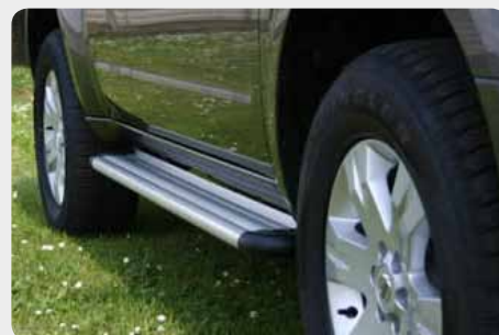
Estribos en plataforma de aluminio. Tipo S50. 072.PF-50814-I - doble cabina