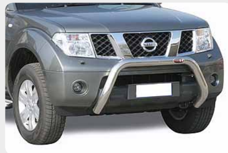
Defensa central inox baja sin traviesa. Homologación CE. 072.PF-33003 - Ø70mm