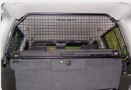
Separador de carga interior.