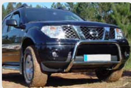
Defensa central inox baja sin grabación. Homologación CE. 189.5269.CE - Ø60mm