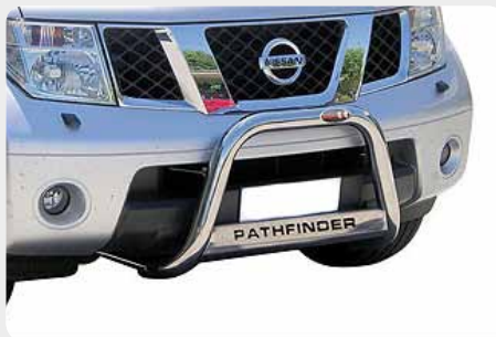
Defensa central inox baja con grabación. Homologación CE. 072.PF-31003 - Ø60mm