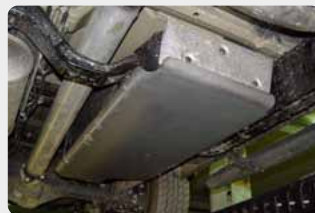
Protector de dep sito. 189.5255 - acero zincado 189.5256 - duraluminio