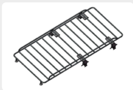
Baca de carga portaequipajes grande semi-abierta (cierres lateral). 6 soportes.