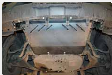
Protector radiador SHERIFF. *S lo para Pathfinder [2005-2010] 190.15.1330 - acero 190.15.1331 - aluminio