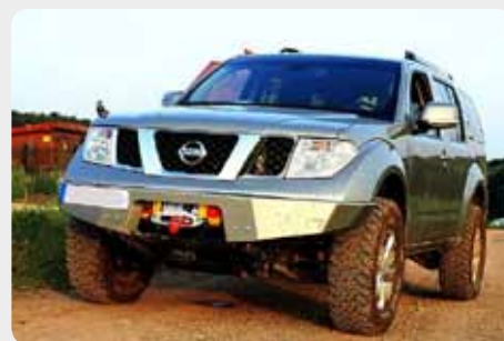
Parachoques frontal con base de cabestrante. 189.48001356