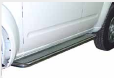
Estribos en plataforma de aluminio (gota) con tubo inox Ø50mm. 189.5233 - doble cabina