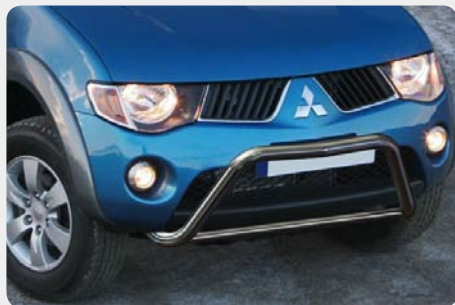
Defensa central inox baja sin grabación, Ø60mm. Homologación CE. 189.6171.CE