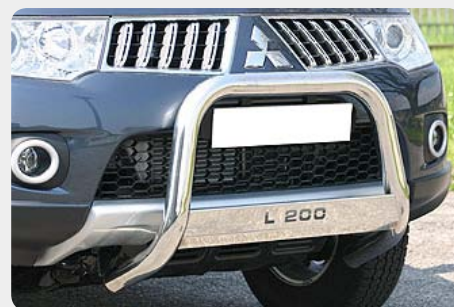
Defensa central inox baja con grabación, Ø60mm. Homologación CE.