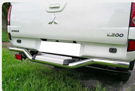
Protector inferior para parachoques trasero en tubo inox.