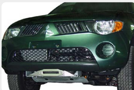
Base de cabestrante "oculta" para instalar con parachoques de origen. 189.6101