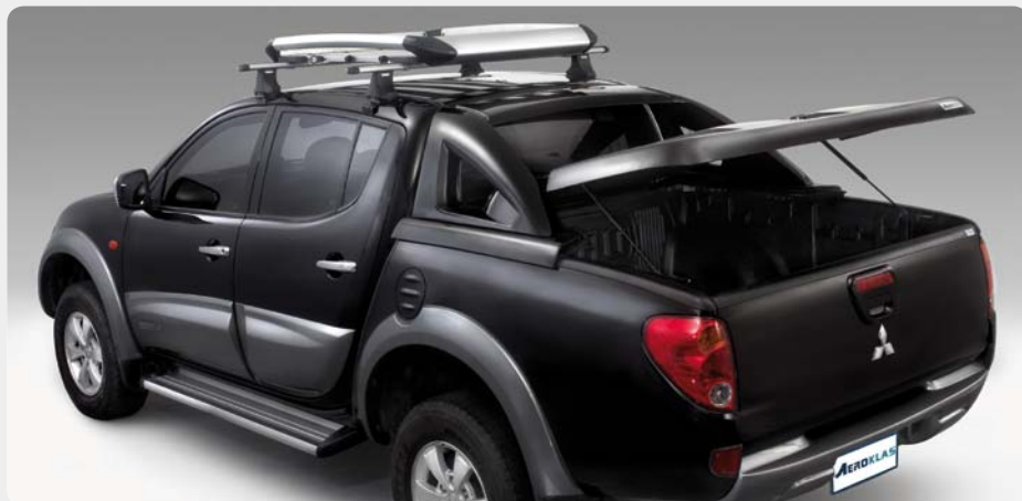
Fullbox AEROKLAS, en fibra.