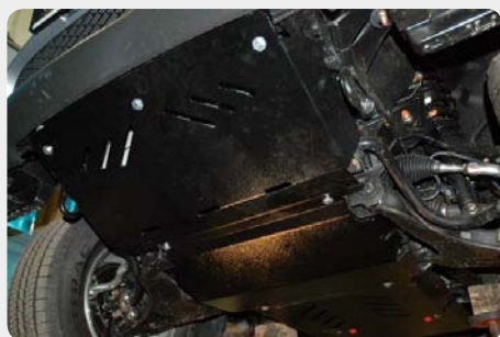
Protector de c rter SHERIFF. 190.14.1143 - acero zincado 190.14.1144 - aluminio