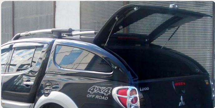
HardTop Sport FOURWHEELER, en fibra. 007.MT2-01 - doble cabina