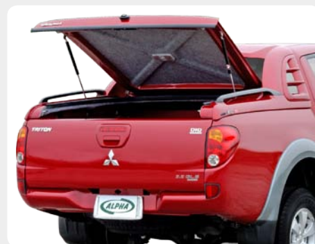
002.MT-9000 - doble cabina