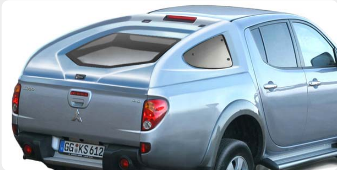
HardTop Sport AEROKLAS, en fibra de vidrio. 001.MT2-0056 - doble cabina