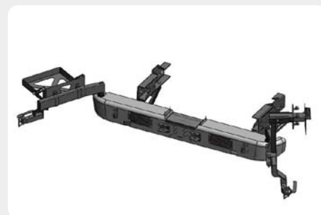
Parachoques trasero con soporte de rueda y bidón.