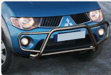
Defensa integral inox baja sin grabación, Ø60mm. Homologación CE. 189.6176.CE