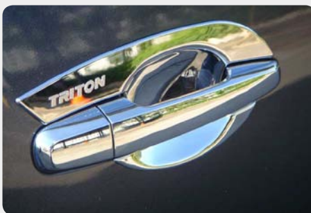
Fondo de maneta cromado. 001.453