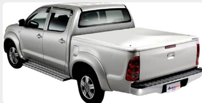
Cubierta plana AEROKLAS en fibra.