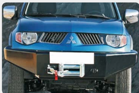
Parachoques frontal con base de cabestrante. 189.6170