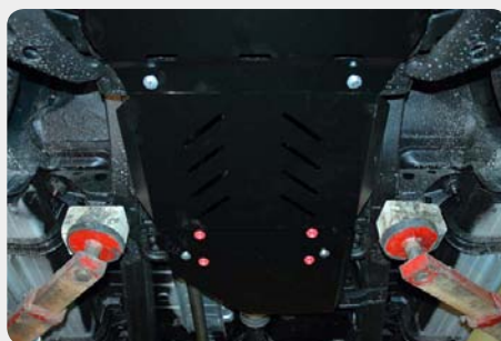
Protector de tr nsfer y caja de cambios SHERIFF. 190.14.1145 - acero zincado 190.14.1146 - aluminio