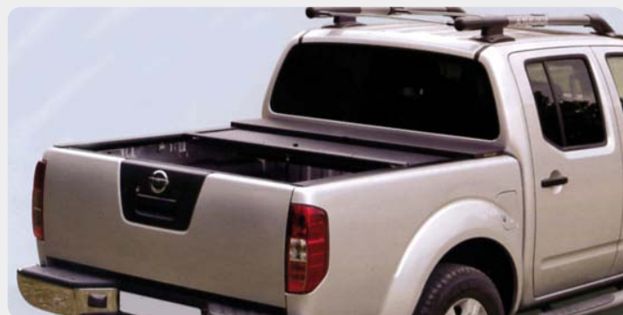
Cubierta plana enrollable FOURWHEELER en aluminio. Tipo persiana.