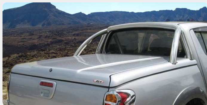
Fullbox FOURWHEELER en fibra con arco en acero inox.