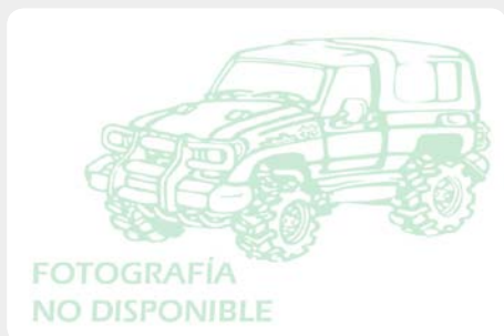
Base de cabestrante "oculta" con protector en duraluminio para instalar con parachoques de origen. 189.6143