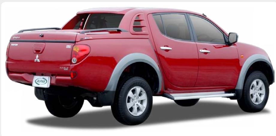
Fullbox (Sport Cover) ALPHA en fibra.