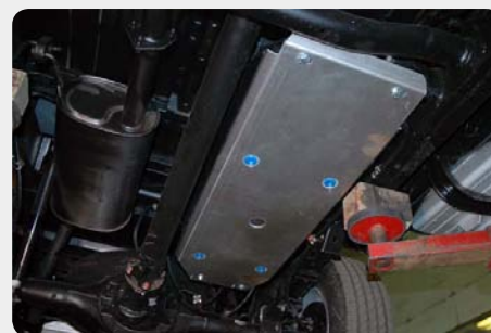
Protector de dep sito SHERIFF. 190.14.1147 - acero zincado 190.14.1148 - aluminio