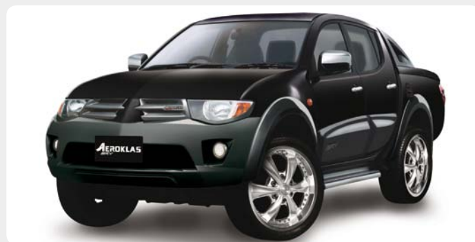
Kit de carrocería (SRV) AEROKLAS en ABS.