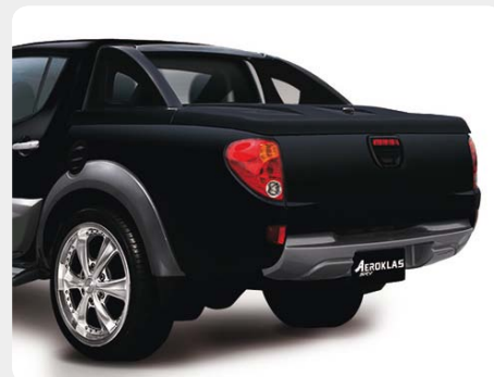
001.MT2-9000 - doble cabina