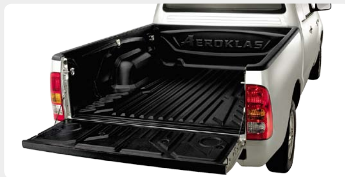
Bedliner (forro de caja) AEROKLAS en ABS.