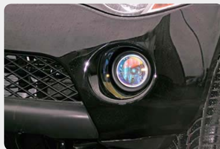
Kit de faros antiniebla tipo original. 072.PK-51192