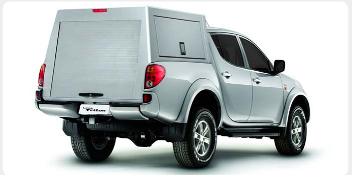
HardTop en aluminio con persianas laterales y trasera. 189.48001493 - extra cabina