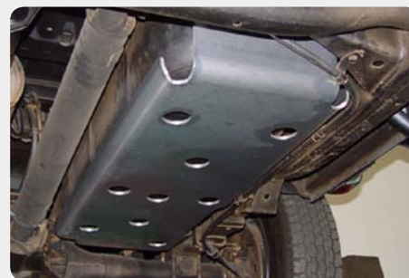
Protector de dep sito. 189.6122 - acero zincado 189.6123 - acero en negro 189.6124 - duraluminio