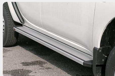
Estribos en plataforma de aluminio. Tipo STD. 072.PK-51190 - doble cabina