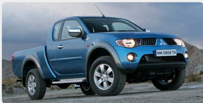
* L200 "Tritón" [2006 - 2009]