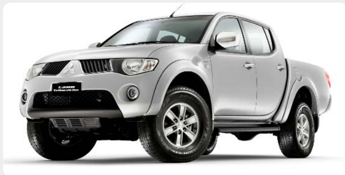
* L200 "Tritón" "Long bed" [2010 - ]