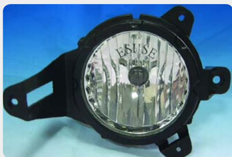
Kit de faros antiniebla. 007.FL-MB018-AC