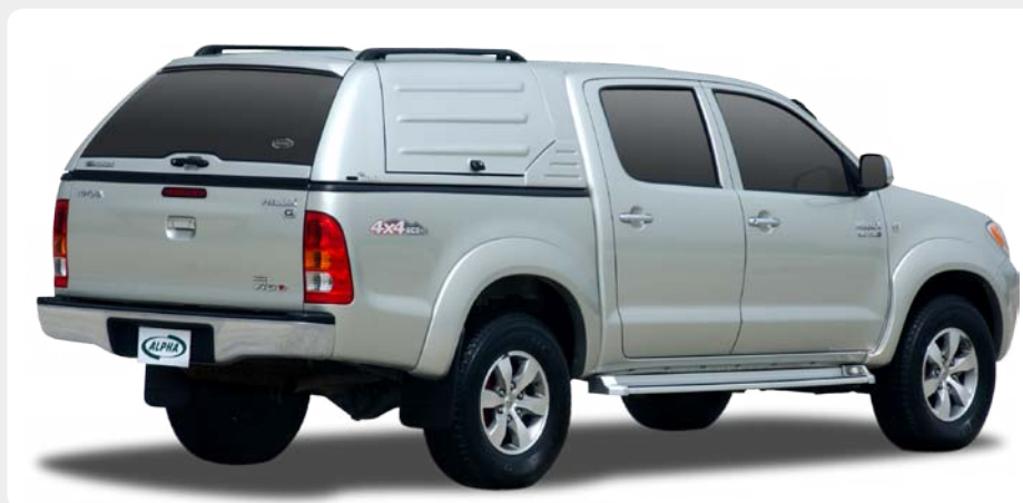
HardTop de trabajo ALPHA CML, en fibra. Portones laterales de apertura tipo "ala de gaviota".