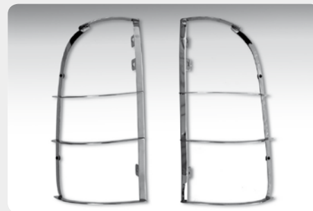
Protectores de pilotos traseros en acero inox. 2 piezas. 001.MT-9920