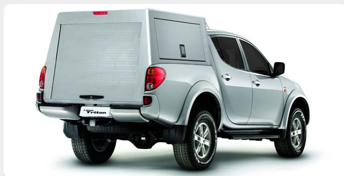
HardTop en aluminio con persiana trasera.