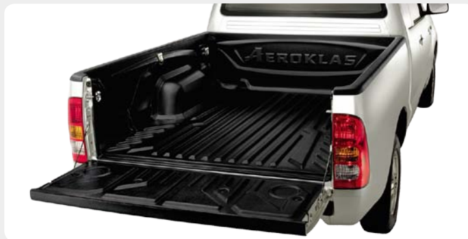
Bedliner (forro de caja) AEROKLAS en ABS.