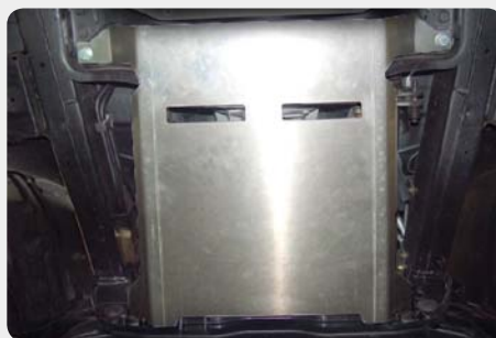
Protector de caja de cambios. 189.6180 - acero zincado 189.6181 - duraluminio