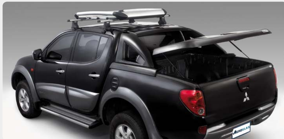
Fullbox AEROKLAS en fibra "desmontable".