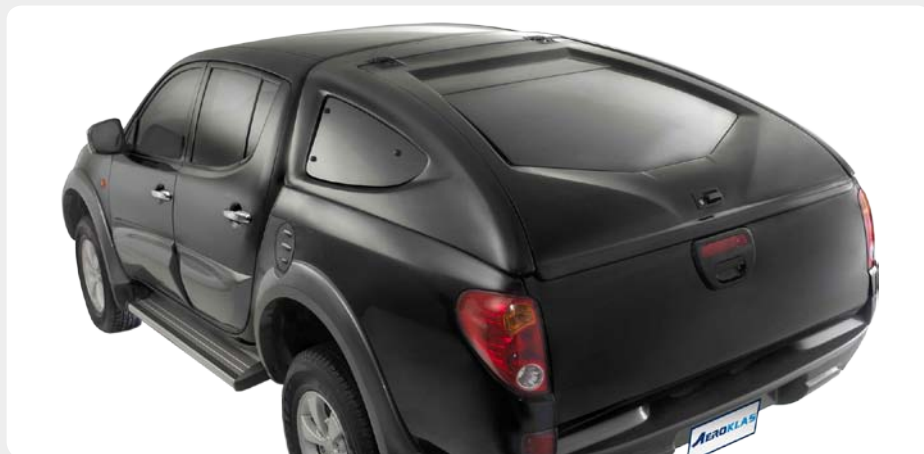
HardTop Sport AEROKLAS en fibra de vidrio.