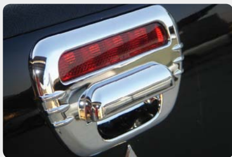
Embellecedor de portón trasero. 001.252 - cromado