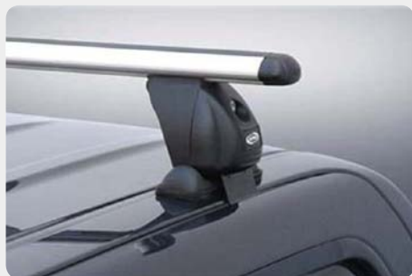
Barras de techo transversales para cabina. 002.AS-TRI