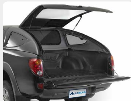
001.MT-0056 - doble cabina