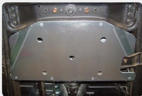
Protector de tr nsfer. 189.6118 - acero zincado 189.6119 - duraluminio