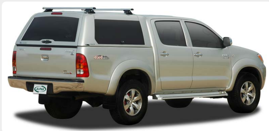
HardTop ALPHA CME, en fibra. Portones laterales tipo "ala de gaviota".