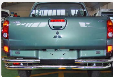
Parachoques trasero en doble tubo Ø60mm. 189.6114 - inox 189.6115 - negro