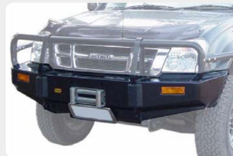
Parachoques frontal FOURWHEELER con base de cabestrante. 007.MT-5000