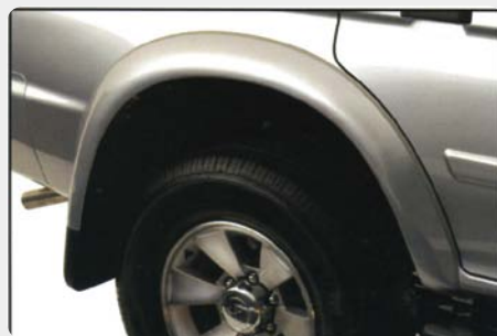
Juego de aletines en ABS. *S lo para modelos doble cabina. 001.MT-9925