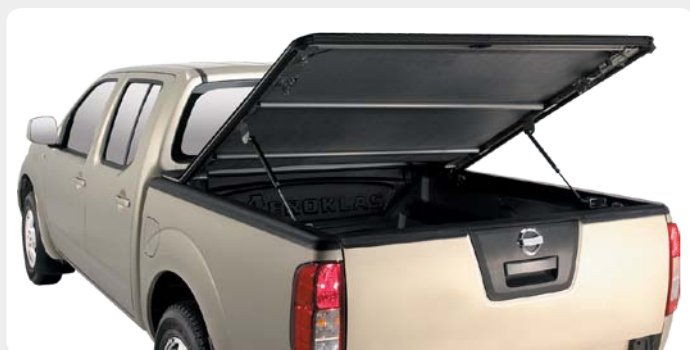
Toldo plano AEROKLAS doble apertura (45° y enrollable).