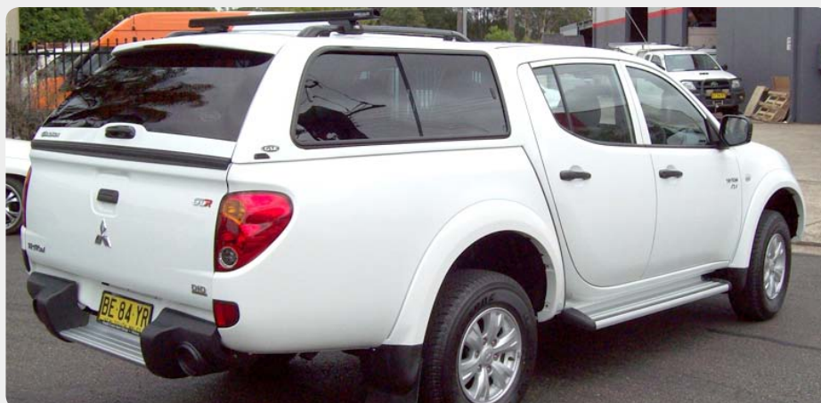
HardTop ALPHA, en fibra.