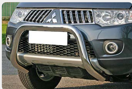
Defensa central inox baja sin travesía, Ø70mm. Homologación CE.