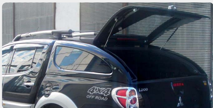
HardTop Sport FOURWHEELER, en fibra.