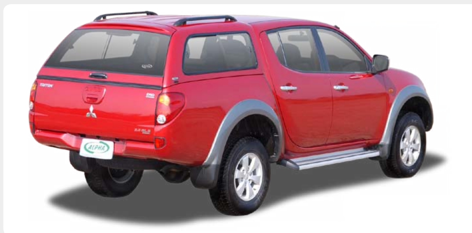
HardTop ALPHA, en fibra.