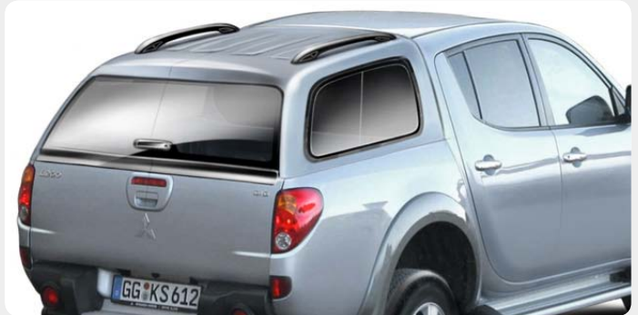
HardTop AEROKLAS, en ABS. 001.MT2-0054 - doble cabina, con ventanas 001.MT2-0055 - doble cabina, sin ventanas.