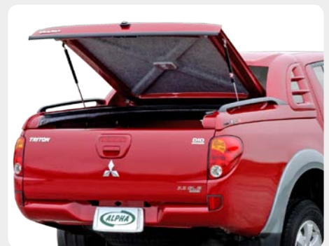
002.MT2-9000 - doble cabina