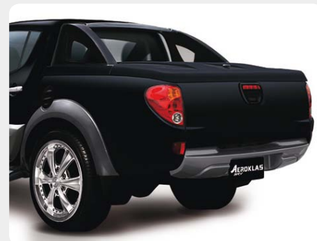
001.MT-9000 - doble cabina