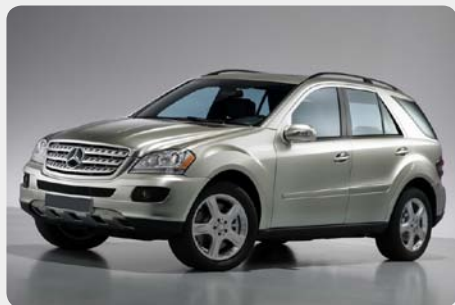
*Clase M [2007 - ]