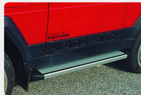
Estribos en plataforma de aluminio. Tipo STD.