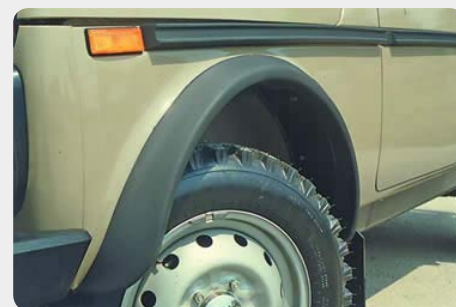
Juego de aletines en ABS, 4piezas.