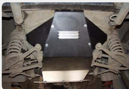
Protector de caja de cambios SHERIFF.