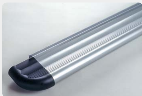
Estribos en plataforma de aluminio. Tipo S50.