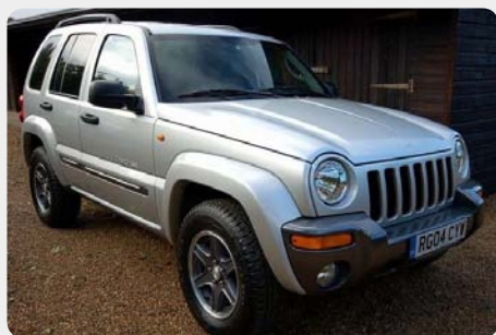
* Cherokee [2001 - 2008]