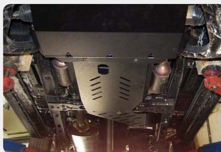
Protector de caja de cambios SHERIFF. *Sólo para [2005 - ] 190.04.0975 - acero zincado