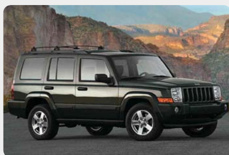
* Commander [2006 - ]