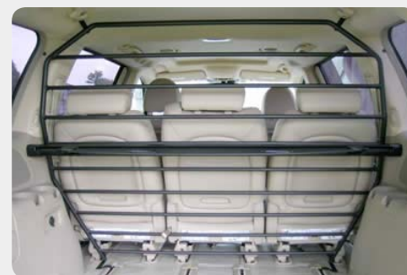
Separador de carga interior. 072.JC-50927