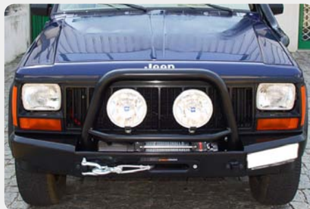
Parachoques frontal con base de cabestrante. 189.5051