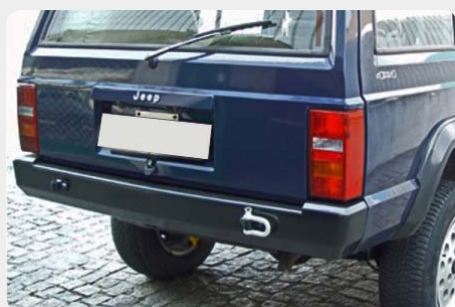
Parachoques trasero. 189.5052