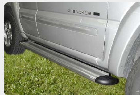
Estribos en plataforma de aluminio. Tipo S50. 072.JC-50922-I