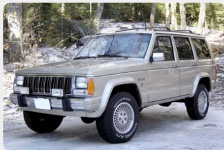
* Cherokee [1984 - 2001]