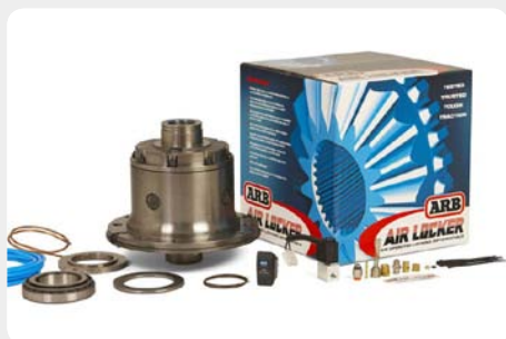
Bloqueo de diferencial delantero DANA, 27 estrias. 188.RD-100 - Ø30, 3.73 en adelante 188.RD-101 - Ø30 hasta 3.54 188.RD-102 - Ø35, 3.54 en adelante 188.RD-103 - Ø35, 2.73 o 3.31