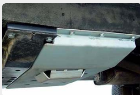
Protector de tr nsfer. 189.5055 - acero zincado