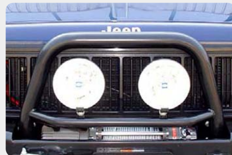
*Arco central con soporte de faros para parachoques frontal 189.5051. 189.5054