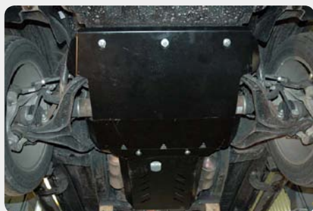
Protector de cárter SHERIFF. *Sólo para [2005 - ] 190.04.0974 - acero zincado