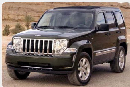
* Cherokee [2008 - ]