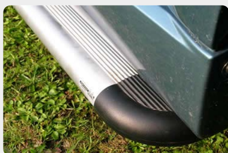
Estribos en plataforma de aluminio. Tipo S50. 072.JE-50653-I