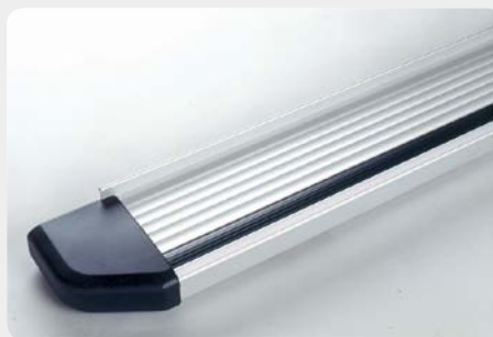
Estribos en plataforma de aluminio. Tipo STD. 072.JC-50922