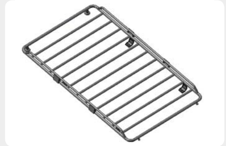
Baca de carga portaequipajes semi-abierta (cierres lateral). 6 Soportes.

*Solo para modelos con techo alto. 189.1835