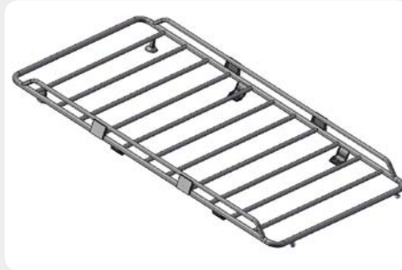
Baca de carga portaequipajes semi-abierta (cierres lateral). 4 Soportes.

*Solo para modelos con techo bajo. 189.1839