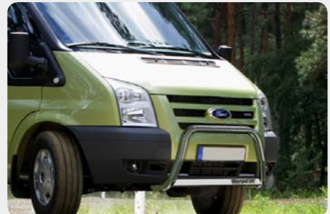
Defensa central inox baja con grabación. Homologación CE.