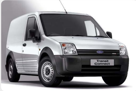
* Transit Connect [2006 - ]