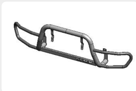
Defensa integral inox baja con grabación. Homologación CE.