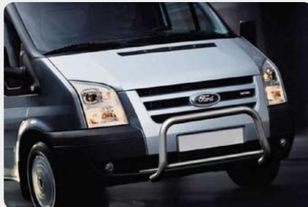
Defensa central inox baja sin grabación. Homologación CE.