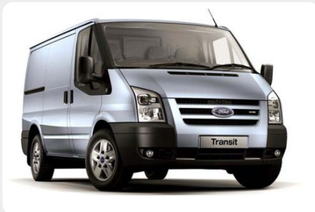
* Transit T280 [2006 - ] modelo corto con techo bajo

*Solo para modelos con techo alto. 189.1835