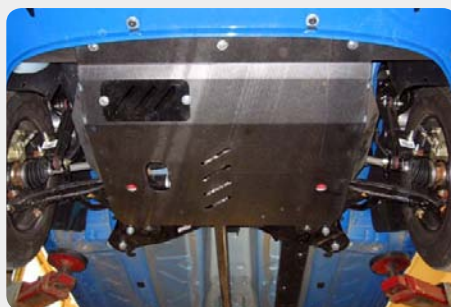
Protector de cárter y caja de cambios SHERIFF.