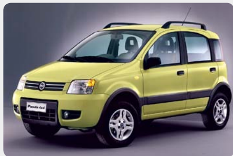
* Panda 4x4 [2005 - ]