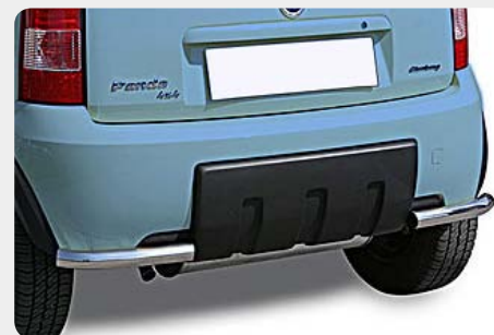
Protector de esquinas traseras en tubo inox.