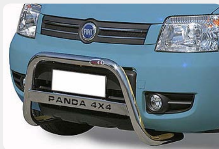
Defensa central inox baja con grabación, Ø50mm. Sin homologación CE.