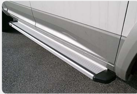
Estribos en plataforma de aluminio. Tipo STD. 072.DO-51813