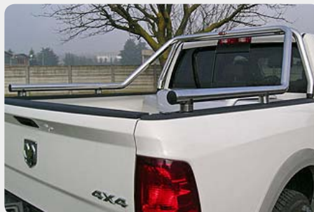
Rollbar (barras antivuelco) en tubo inox, Ø60mm. 072.DO-51812-L