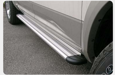
Estribos en plataforma de aluminio. Tipo S50. 072.DO-51813-I