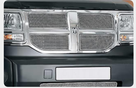
Kit de rejillas cromadas, 5 piezas. 072.DN-51777