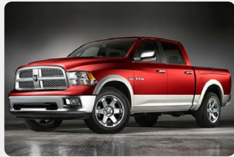
* RAM 2500 [2010 -]