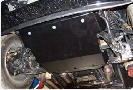
Protector de cárter SHERIFF. 190.04.0974 - acero zincado