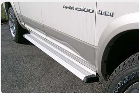
Estribos en plataforma de aluminio. Tipo S25. 072.DO-51813-M