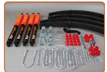
Jeep CJ7 100mm