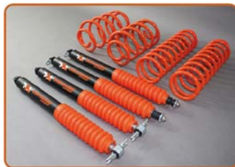
Wrangler TJ 50mm