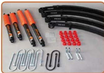
Wrangler YJ 50/100mm