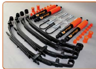
Suzuki Samurai 50mm