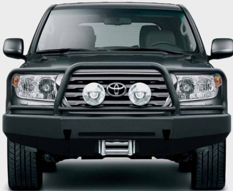
Parachoques frontal con base de cabestrante. Versión África. (Toyota LandCruiser 200)