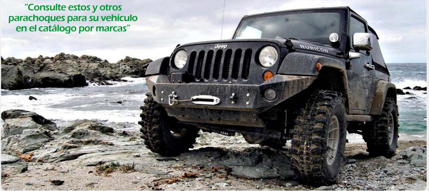
Parachoques frontal con base de cabestrante y huecos para faros antiniebla (Jeep Wrangler)

“Consulte estos y otros parachoques para su vehículo en el catálogo por marcas”