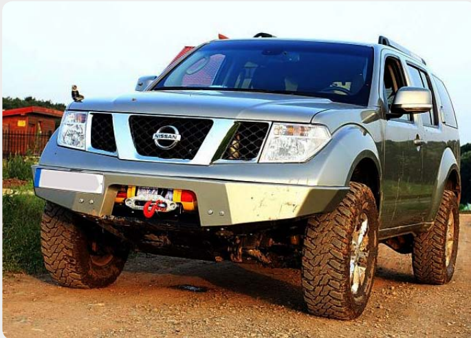
Parachoques frontal con base de cabestrante (Nissan Navara / Pathfinder)