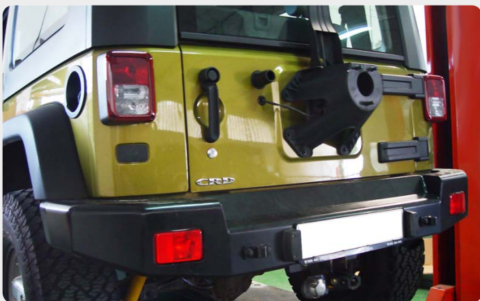
Parachoques trasero con huecos para pilotos (Jeep Wrangler)