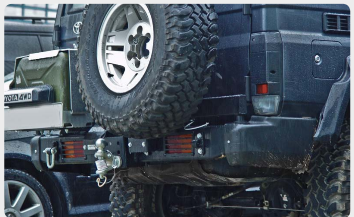
Parachoques trasero con huecos para pilotos y doble soporte de rueda y bidón (Toyota LandCruiser 70)