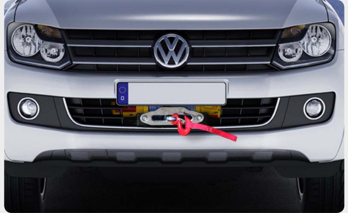
Base de cabestrante oculta para instalar con parachoques de origen (Volkswagen Amarok)