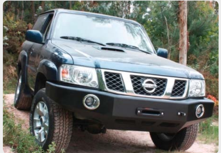
Parachoques frontal con base de cabestrante y huecos para faros antiniebla (Nissan Patrol)