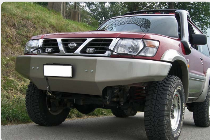
Parachoques frontal con base de cabestrante (Nissan Patrol GR)