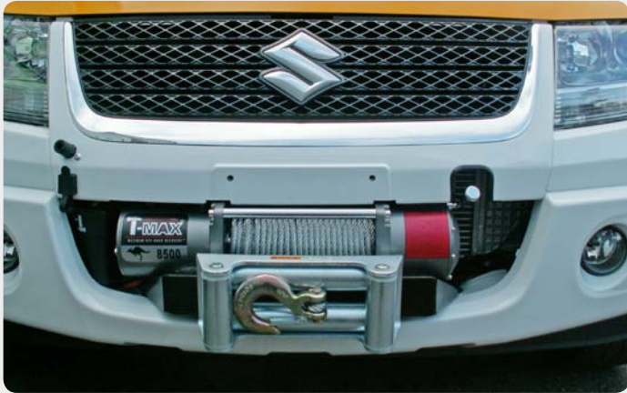
Base de cabestrante oculta para instalar con parachoques de origen (Suzuki Grand Vitara)