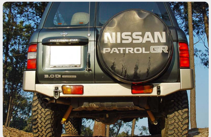
Parachoques trasero con huecos para pilotos. (Nissan Patrol GR)