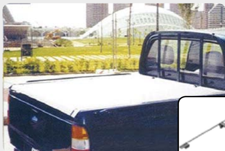
Toldo de lona con estructura plana.

Consultar catálogo por marcas según pick-up