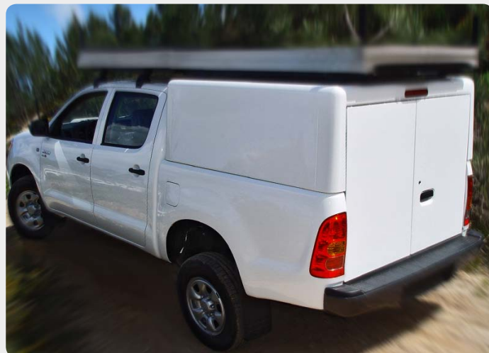
Hardtop de aluminio con portones traseros. Consultar catálogo por marcas según pick-up