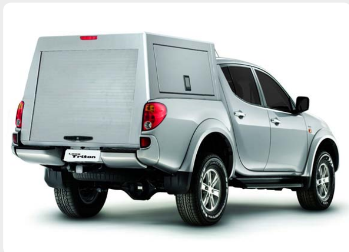
Hardtop de aluminio con ventanas tipo persiana. Consultar catálogo por marcas según pick-up