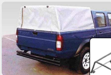
Toldo de lona con estructura en arcos.

Consultar catálogo por marcas según pick-up