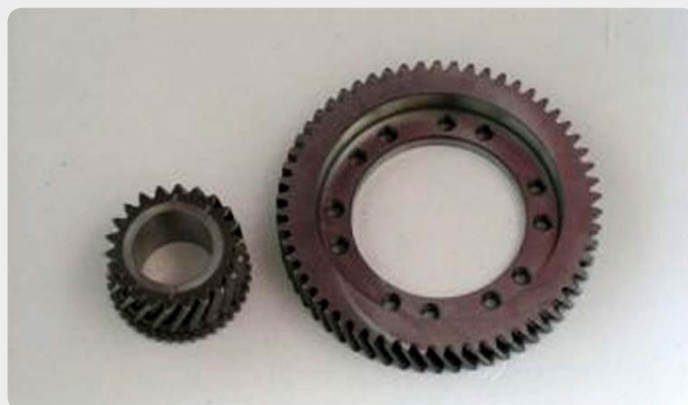
Grupos cortos y reductoras. Consultar según vehículo