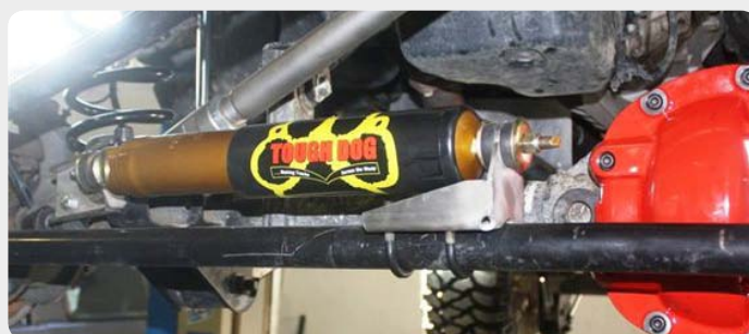
Soportes reforzados para amortiguador de dirección. Consultar según vehículo