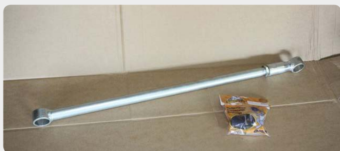
Barras Panhard reforzadas y regulables. Consultar según vehículo