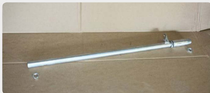
Barras de dirección reforzadas con soporte de amortiguador de dirección. Consultar según vehículo