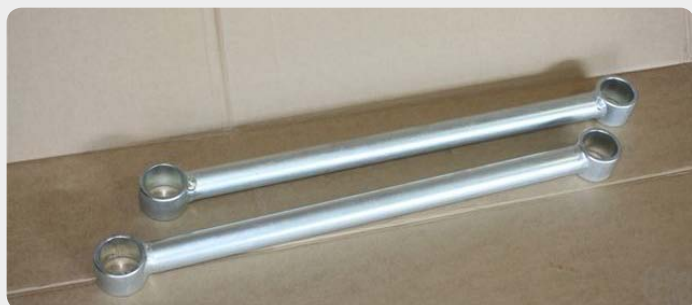
Juego de tirantes reforzados superior e inferior. Consultar según vehículo